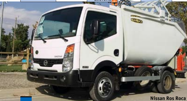
Nissan Ros Roca

каждая. Различие между сериями – это разное строение кузова или схемы работы гидравлических систем, внутри серии – объем кузова и тип применяемого шасси: от 16 до 34 м³, полная масса ТС от 20 до 33 т, колесная формула 4x2, 6x2, 6x4, 8x4. Как сказано в первой части статьи, у иномарок нет готовых технических решений, их российские представители предлагают