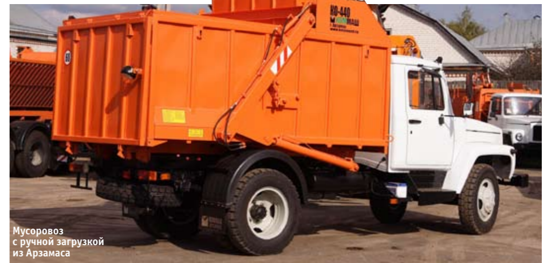
Мусоровоз с ручной загрузкой из Арзамаса

отличаются от предшественников. Здесь мусор собирают в загрузочный ковш, который затем механизированно опорожняется в бункер. Это позволяет разбить процессы погрузки и прессования (у моделей старого образца жильцам приходилось подолгу ждать возвращения плиты на место, а водителю грудью защищать мусорприемник от желающих опустошить свое ведро прямо на гидроцилиндр). Разгрузка у этих машин самосвальная, и в небольших городах, где со времен социализма сохранилась система коммунального «самообслуживания», они до сих пор популярны.