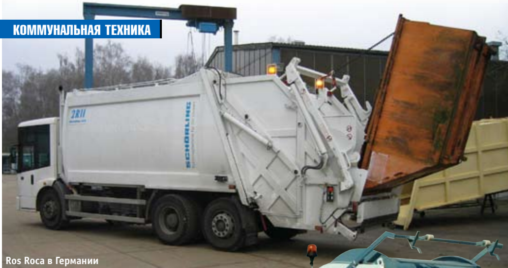
Ros Roca в Германии

потенциальному потребителю доступные варианты кузова и подходящие для него типы шасси. Тем не менее определенные предпочтения складываются, да и сами дистрибьюторы пытаются активнее продвигать отдельные конкретные модели. Так, ЗАО «Коминвест-АКМТ» широко практикует монтаж установок серии T1 на шасси МАЗ и КамАЗ, а в компании «РГ-техно» в 2008 г. сертифицировали вообще все серии мусоровозов на европейских шасси Scania, Volvo, Mercedes-Benz и др.