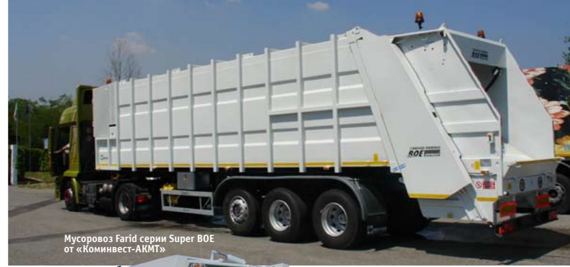
Мусоровоз Farid серии Super BOE от «Коминвест-АКМТ»

Большая часть современных мусоровозов как раз соответствует этому определению, но с одной оговоркой. Сегодня перечисленными характеристиками обладают не только большегрузы, но и средне- и даже малотоннажники! Наши пред-