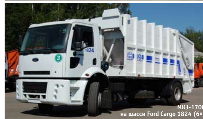
МК3-17002 на шасси Ford Cargo 1824 (6x2)

остается относительно высокой. Самый популярный у нас размер «фауна» – 18 м 3 (модель 518), но существуют и другие варианты «вращающегося пресса» – от 8 «кубов» до невообразимого 41 м 3 !