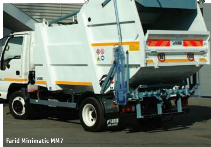
Farid Minimatic MM7

потенциальному потребителю доступные варианты кузова и подходящие для него типы шасси. Тем не менее определенные предпочтения складываются, да и сами дистрибьюторы пытаются активнее продвигать отдельные конкретные модели. Так, ЗАО «Коминвест-АКМТ» широко практикует монтаж установок серии T1 на шасси МАЗ и КамАЗ, а в компании «РГ-техно» в 2008 г. сертифицировали вообще все серии мусоровозов на европейских шасси Scania, Volvo, Mercedes-Benz и др.