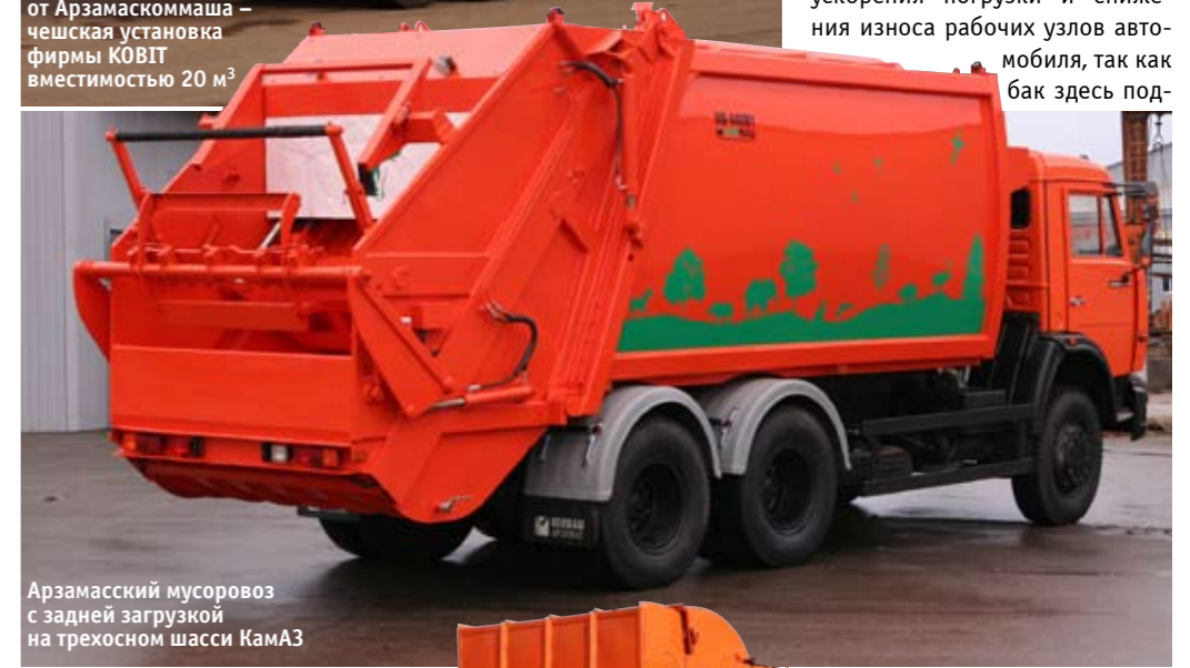
Арзамасский мусоровоз с задней загрузкой на трехосном шасси КамАЗ