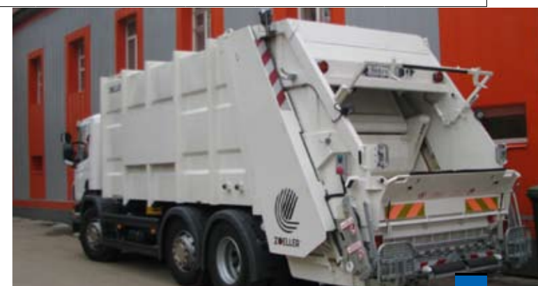
февраль 2010 / Основные Средства 51