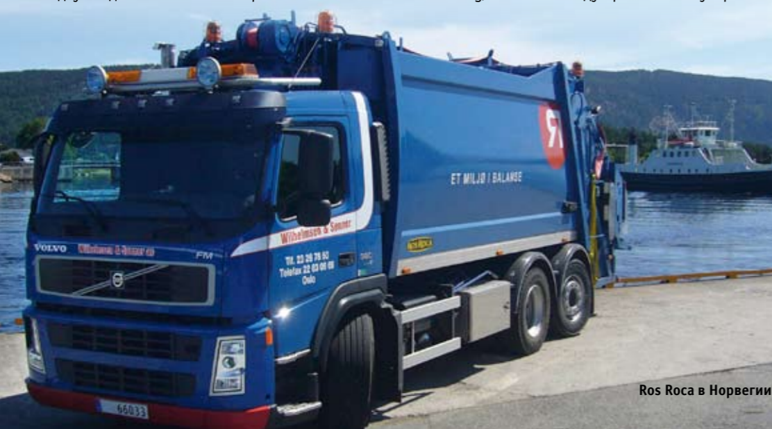
Ros Roca в Норвегии

имуществ. По этой же причине кто-то указывает количество загружаемых контейнеров, а кто-то нет. Однако не стоит целиком ориентироваться на этот показатель, выбирая мусоровоз. Значения «9» он достигает при плотности материала 0,065, «5» – при 0,120 и «2,5» – при 0,240. Так что для рыхлой бумаги и 150 евроконтейнеров в 18-кубовый кузов не предел. А при работе с несортированным мусором полезнее окажется функция регулируемого противодавления, которая защитит гидравлику от поломки, при необходимости уменьшая степень сжатия или вообще останавливая уплотнение. Ошибочно ориентироваться и на цену, ведь для коммерческого автомобиля важна лишь стоимость 1 км пробега, а для мусоровоза – еще и затраты на вывоз мерной технической единицы, например контейнера 1,1 м 3 . В конечном счете снижение издержек обеспечивается не чудесными способностями одной лишь машины, а эффективной организацией бизнеса в целом.