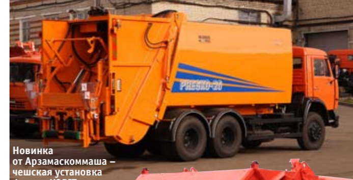
Новинка от Арзамаскоммаша – чешская установка фирмы KOBIT вместимостью 20 м 3

Снижение эксплуатационных расходов при работе мусоровоза с задней загрузкой с передвижными контейнерами достигается за счет исключения маневрирования машины на площадке, ускорения погрузки и снижения износа рабочих узлов автомобиля, так как бак здесь под-