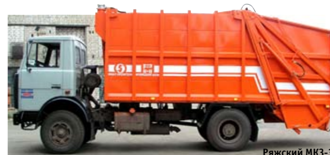
Рязский МК3-35 на двухосном шасси МАЗ

ленный ГК «РГ» на шасси МАЗ. В Rotopress загрузочный бункер конической формы подает мусор по шнекам во вращающийся цилиндрический кузов, по винтовым ребрам которого ТБО перемещаются к передней стенке, где дополнительно разрушаются режущими кромками. Это позволяет и повысить итоговую степень уплотнения, и пригодится при работе с сортированными отходами, отправляемыми в переработку, так как проводится их первичное измельчение. Выгрузка осуществляется вращением кузова в обратном направлении при поднятом заднем борте. Для механизированной погрузки встраивается кантователь Zoeller. Сама конструкция обеспечивает защиту мусоровоза от поломок, а масса надстройки меньше, чем у аналогов с прессующей плитой. Сразу три российские компании занимаются монтажом такого оборудования: арзамасский «Коммаш», «РГ-техно» и московский «Коммаш», можно найти его и на вторичном рынке, но даже у подержанной «чудо-машины» цена