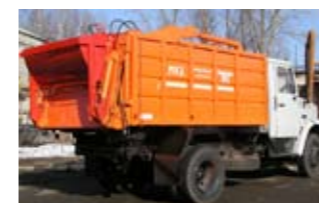
Рязский мусоровоз с ручной загрузкой

жая то, что собрали, в мусоровоз больших размеров, который по заполнению в свою очередь опорожняется в еще больший, а в загородное турне на свалку, станцию сортировки или завод по переработке отправляется какой-нибудь «супер» или вообще транспортный мусоровоз на полуприцепе.