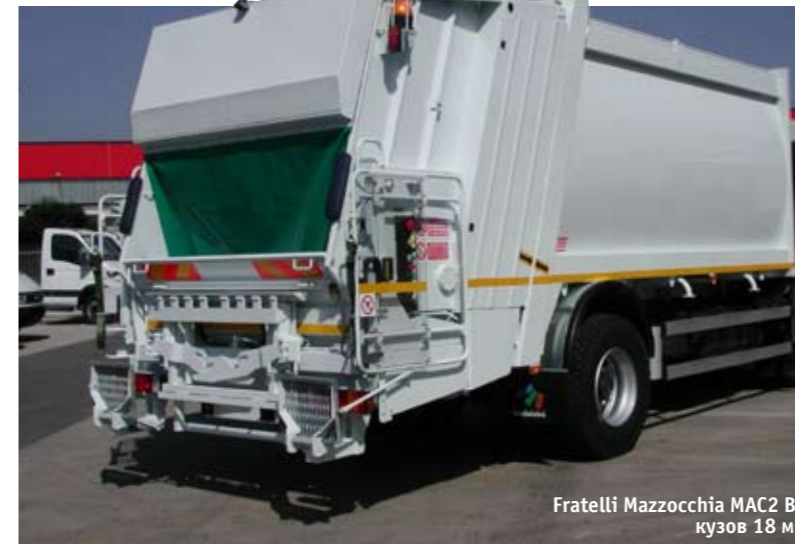
Fratelli Mazzocchia MAC2 B, кузов 18 м 3